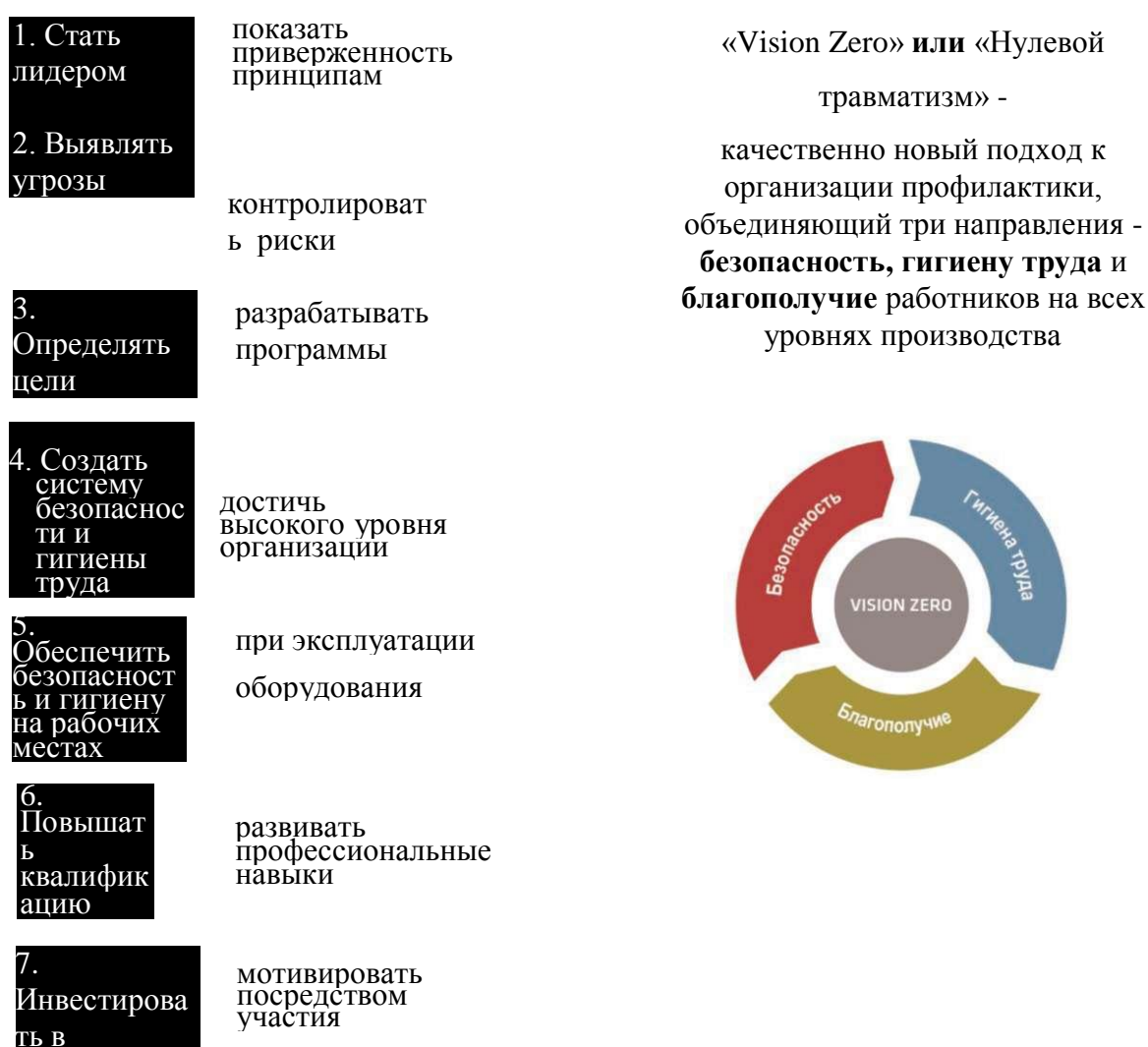
Рис. 1. Семь «золотых правил» производства с нулевым травматизмом и безопасными условиями труда (концепция «Нулевого травматизма» (Vision Zero))

производственного травматизма и профессиональной заболеваемости, (представлены на рис. 1).